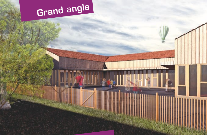
Vue côté cour.