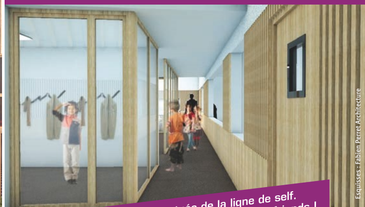
Vue sur l'entrée de la ligne de self. Les enfants devraient en être friands !